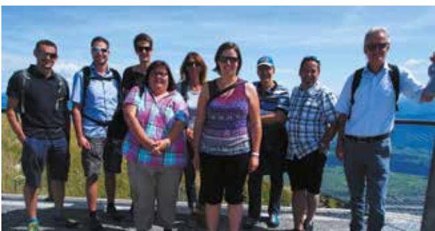
Der Ausflug der Bereichsleitungen mit dem Team Technischer Dienst führte dieses Jahr nach Appenzell und auf den Hohen Kasten.