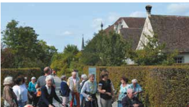
Erholung pur im wunderbaren Garten der Kartause Ittingen.