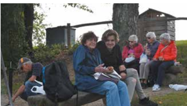
Idylle und Zufriedenheit im Naturschutzgebiet des Nussbaumersees.