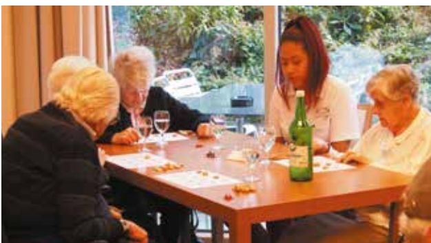
Vier Gewinner durften beim Lottoabend eine Riks- schafahrt als Preis entgegnehmen.