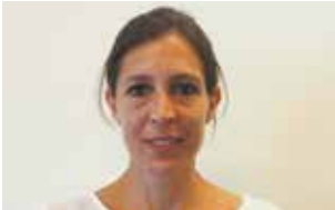
Claudia Gut Gastronomie Café/Saal

Wir heissen die neuen Mitarbeiterinnen herzlich bei uns willkommen und wünschen ihnen viel Freude und Erfolg im neuen Wirkungsbereich: