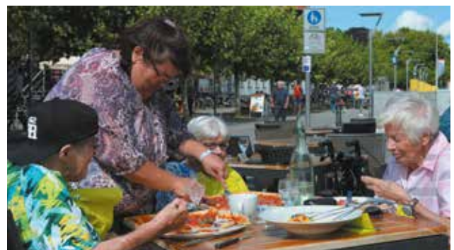
Nach dem „Sealife“ in Konstanz mündet eine Pizza besonders!