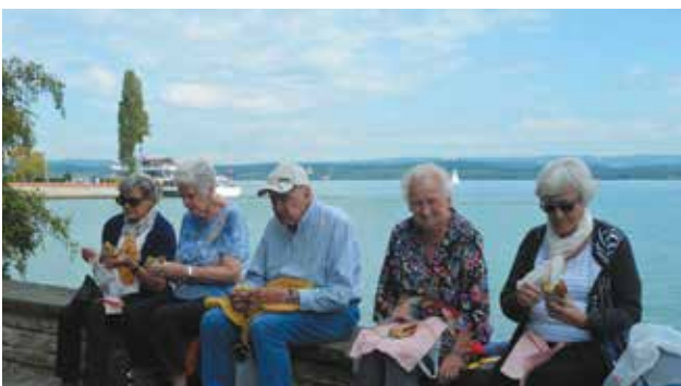
Picknick auf der Blumeninsel Mainau.