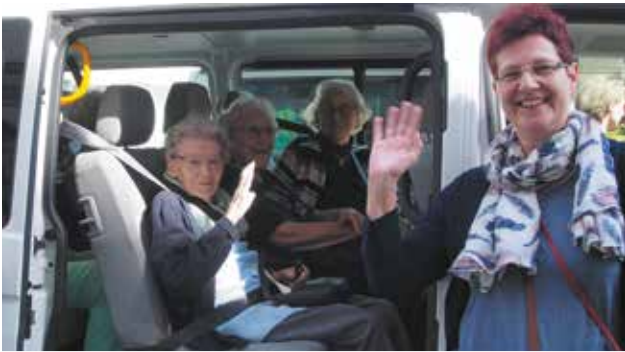
In Kleinbussen sind wir startklar zur Fahrt in die Ferien an den Bodensee!