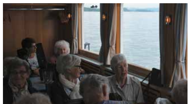
Eine Schiffsreise ist lustig, besonders für uns Bergler...