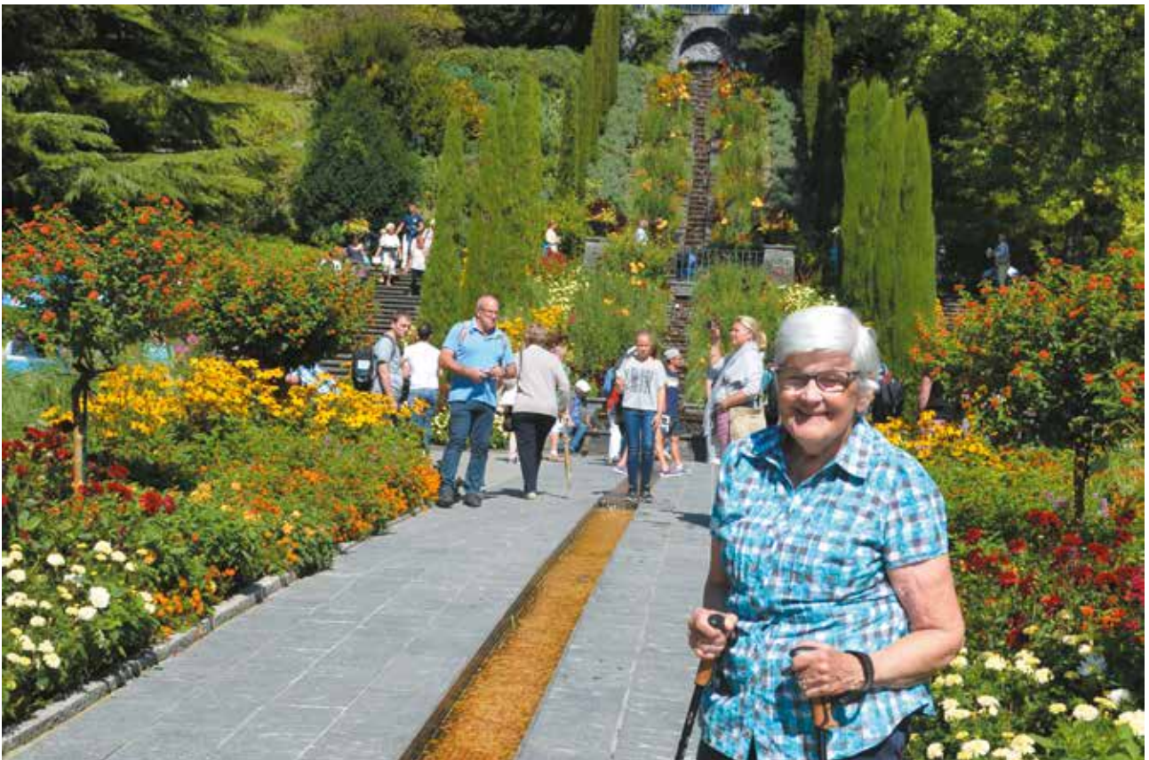
Auf der Mainau