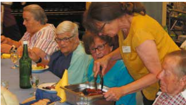
Der Grillabend wurde auch in diesem Sommer zu einem beliebten Programm-Punkt.