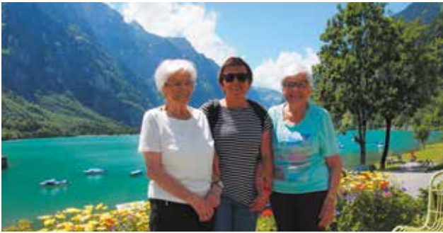
Unsere Bewohner und Mieter durften bei wunderbarem Wetter den Car-Ausflug an den male- rischen Klöntalersee erleben und geniessen.