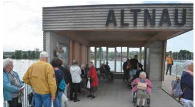
In Altnau besteigen wir das Schiff zur Insel Mainau.