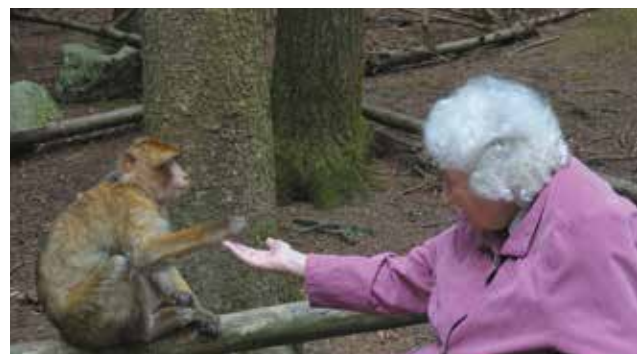
Popcorn für die Tierchen am Affenberg!