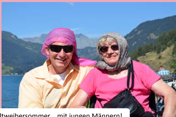
Altweibersommer... mit jungen Männern!