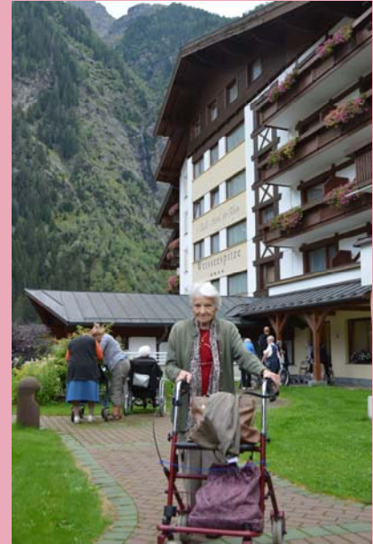
Ferienzeit... Ausgelassenheit... Beziehungspflege!