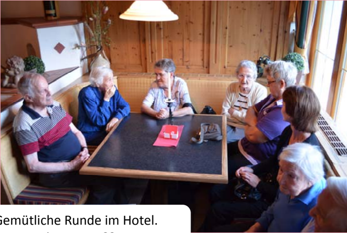
Gemütliche Runde im Hotel. Wer macht en Jass??